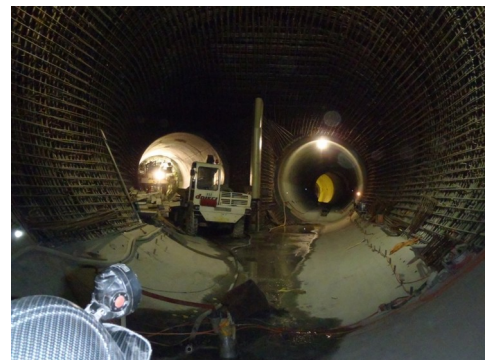
图二：监测方位的传感器