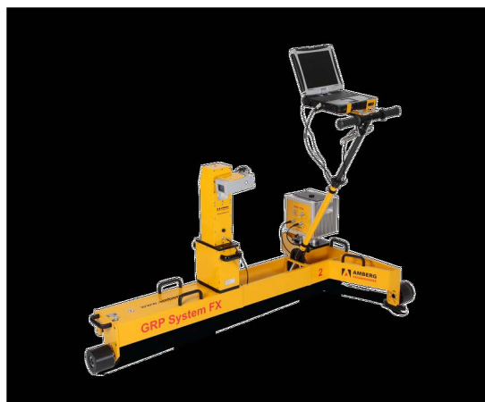
图2：Amberg GRP3000 系统