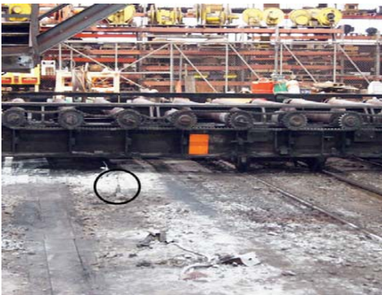
图 1：在运输车上安装反射板

一家全球性的钢铁生产厂正在经历生产停机的危机，因为用于运输巨大的炽热钢板的大型运输车（长度为 200 英尺）时常会超出平时穿梭的位置或与运输轨道线末端的障碍物碰撞，而这些大型运输车会触发安装在地面上的微动开关，从而使整个钢铁生产厂发生停机。（微动开关安装在轨道 55 至 60 英尺处，有六个点）